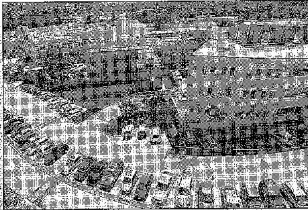
Un'immagine dell'Area di ricerca a Padriciano

attraverso brevi periodi di scambio (staff exchange) e attività di lavoro in rete tra varie organizzazioni di ricerca europee. In linea genera-