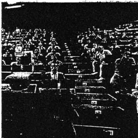
Due immagini di convegni svoltisi in passato al Centro di fisica di Miramare