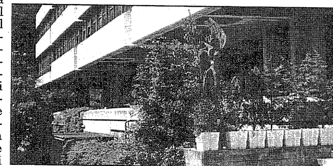
Il Centro di fisica vuol sviluppare la collaborazione.

Compito dell'Ictp è favorire i contatti dei centri scientifici europei con quelli di Paesi fortemente interessati a questi problemi: come la Cina, l'India, il Kenya, le Filippine, il Brasile. E pensiamo di utilizzare la rete degli «associati» del Centro di fisica per consentire ai ricercatori del Terzo Mondo di venire a Trieste fare ricerca utilizzando l'archivio di dati di Promise».