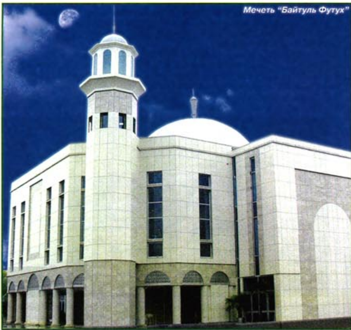
Мечеть "Байтуль Футух"